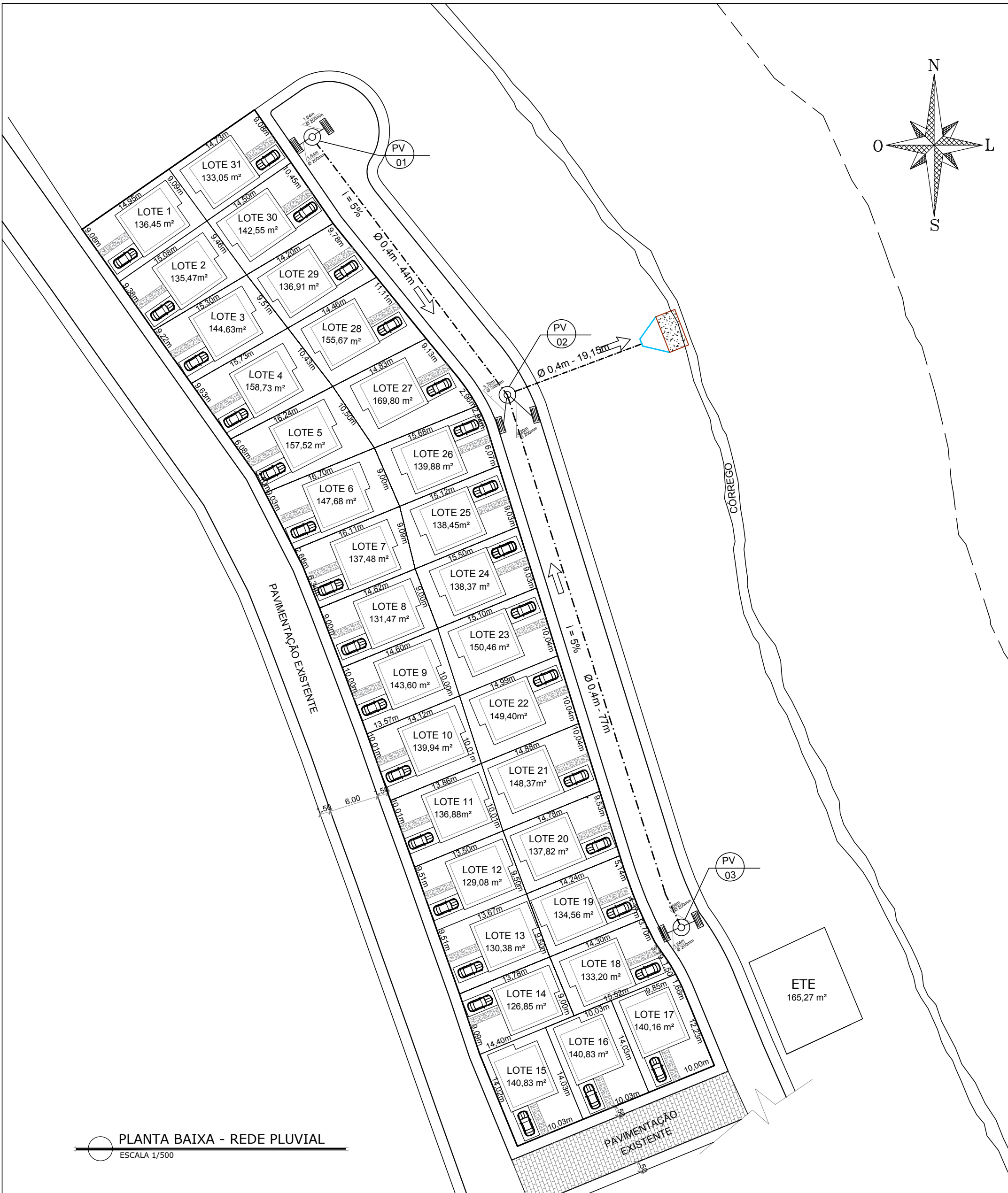
PLANTA BAIXA - REDE PLUVIAL ESCALA 1/500