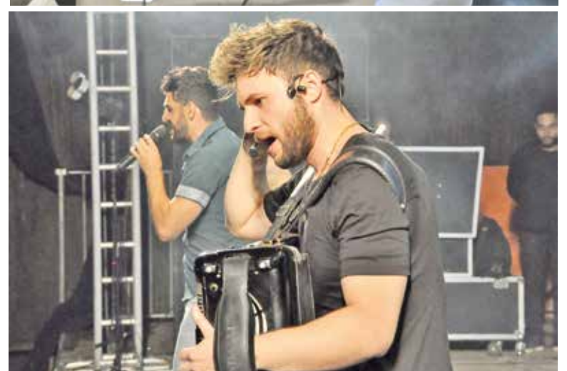
Todos os shows da Festa de Guaçuí contaram com um público de milhares de pessoas que lotaram o Parque de Exposições.