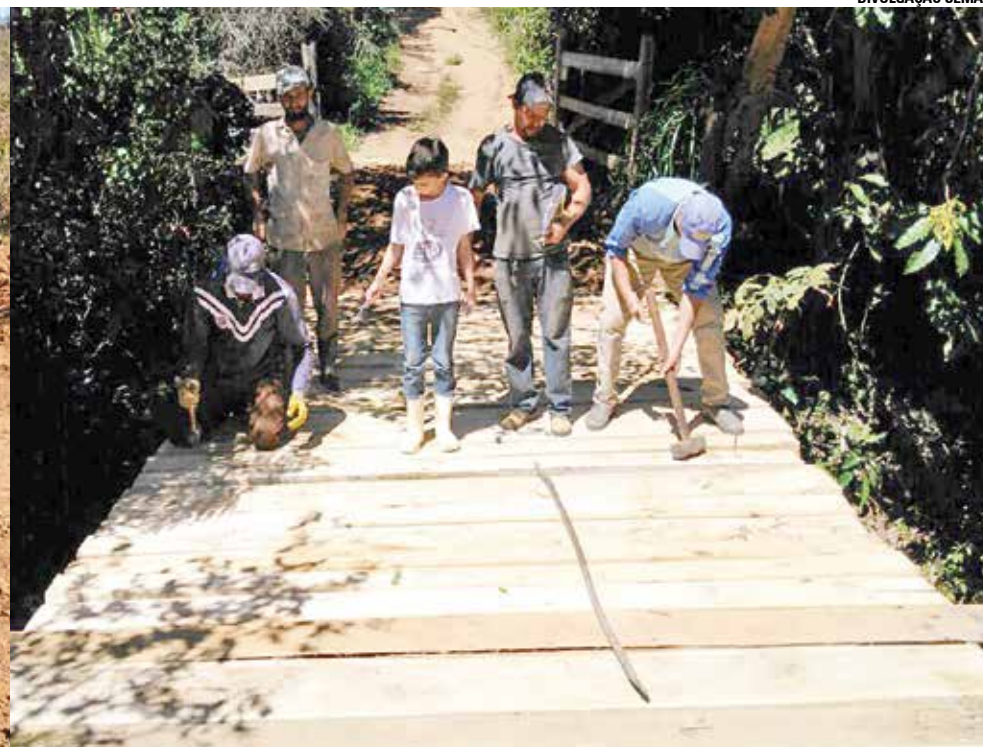
A equipe da Semag continua realizando a recuperação de pontes, mata burros e a construção de rede de manilhas.

A equipe da Secretaria Municipal de Agricultura (Semag) de Guaçuí continua com a realização de serviços na zona rural do município, principalmente, a construção de pontes e mataburros, além de re-