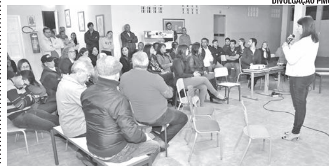
A audiência pública sobre PPA no distrito de São Tiago aconteceu na Escola Municipal José Antônio de Carvalho.

O distrito de São Tiago, em Guaçuí, também discutiu propostas para o Plano Plurianual (PPA) 2018/2021. Isso aconteceu numa audiência realizada na noite de 2 de agosto, na Escola Municipal José Antônio de Carvalho, que foi realizada pela Prefeitura, por meio da Secretaria Municipal de Planejamento. A reunião contou com a presença de moradores e autoridades municipais, entre estas, a prefeita Vera Costa.