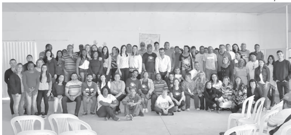
Durante o encontro, os usuários e profissionais dos Caps envolvidos participaram de atividades.

Guaçuí sediou no dia 29 de agosto, o Encontro Anual do Centro de Atenção Psicossocial (Caps) da região sul do Estado. O evento aconteceu na sede do Rotary Club, com a participação dos Caps de outros quatro municípios. A cada ano, o encontro acontece numa das cidades sul capixabas.