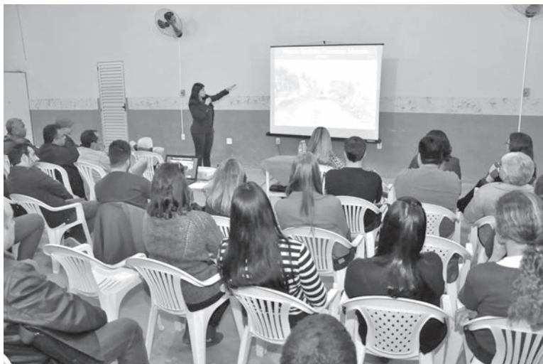
As audiências discutiram as propostas para o PPA na sede e nos distritos de São Pedro de Rates, São Tiago e São Miguel do Caparaó.

quadro. E depois de apresentadas as realizações, a prefeita relacionava os itens para o PPA 2018/2021, já apontados pela administração, ouvindo também as sugestões das pessoas presentes nas audiências.