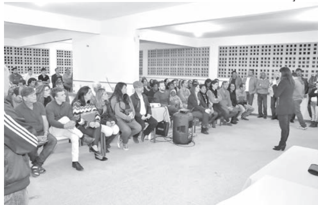
A audiência realizada em São Miguel do Caparaó foi a última de quatro programadas pela Prefeitura de Guaçuí.