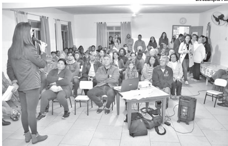
A reunião aconteceu na noite de 23 de agosto, com a participação de moradores e autoridades municipais.

Logo, será concedido o registro do imóvel e não a escritura. “O mais importante é o registro que conta toda a