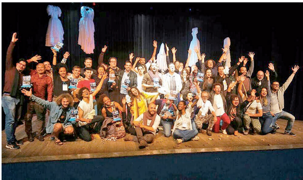
A noite de premiação e encerramento do Festival de Teatro de Guaçuí foi realizada na noite do dia 19.

O 18º Festival Nacional de Teatro aconteceu de 13 a 19 de agosto, com peças infanto juvenis e adultas