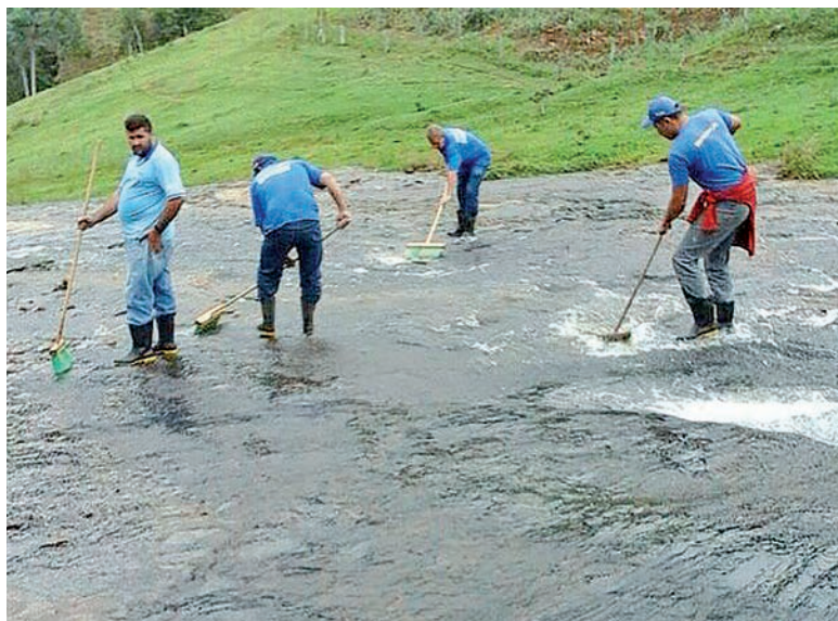
A equipe de Vigilância em Saúde realizou a escovação da cachoeira, visando combater as larvas do borrachudo.

A equipe de Endemias, da Secretaria Municipal de Saúde de Guaçuí realizou ações para o combate aos borrachudos no distrito de São Pedro de Rates. Uma das ações foi a escovação das pedras da cachoeira existente no local, para matar as larvas do mosquito que deposita ovos e procria em água de corredeiras.